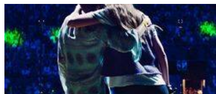
Hakuna lanza una nueva película el 14 de febrero: «Descalzos», dirigida por Santos Blanco («Libres»)