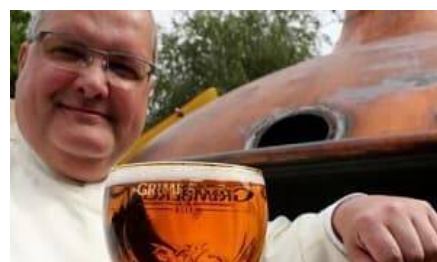
¿Sabías que una santa y doctora de la Iglesia fue quien transformó la cerveza que hoy disfrutas?