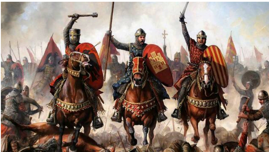
'La carga de los tres reyes' de Augusto Ferrer-Dalmau, que recoge la determinación de los reyes de Navarra, Castilla y Aragón en la batalla decisiva de Las Navas de Tolosa. Esa victoria de 1212 solo fue posible gracias al tesón y arrojo demostrado siglos antes por los iniciadores de la Reconquista.