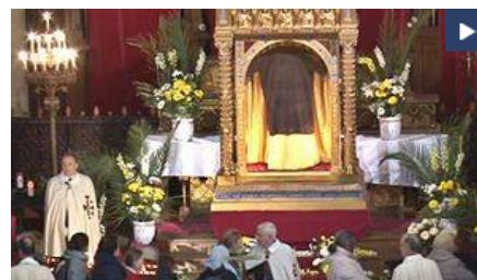
La Santa Túnica de Argenteuil: una reliquia real que casa con la Sindone y el Sudario de Oviedo