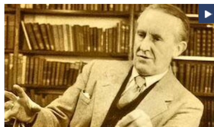
Los personajes de «El Señor de los Anillos» no son cristianos, pero pueden hacernos cristianos