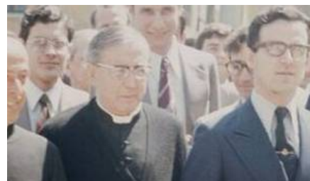
10 normas que San Isidro...