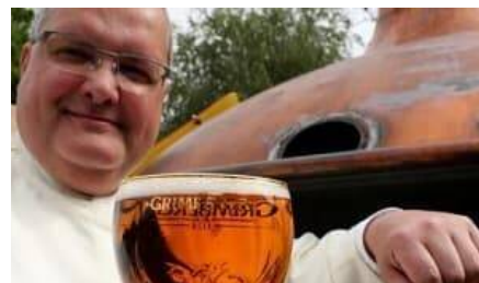
¿Sabías que una santa y doctora de la Iglesia fue quien transformó la cerveza que hoy disfrutas?