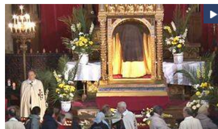
La Santa Túnica de Argenteuil: una reliquia real que casa con la Sindone y el Sudario de Oviedo